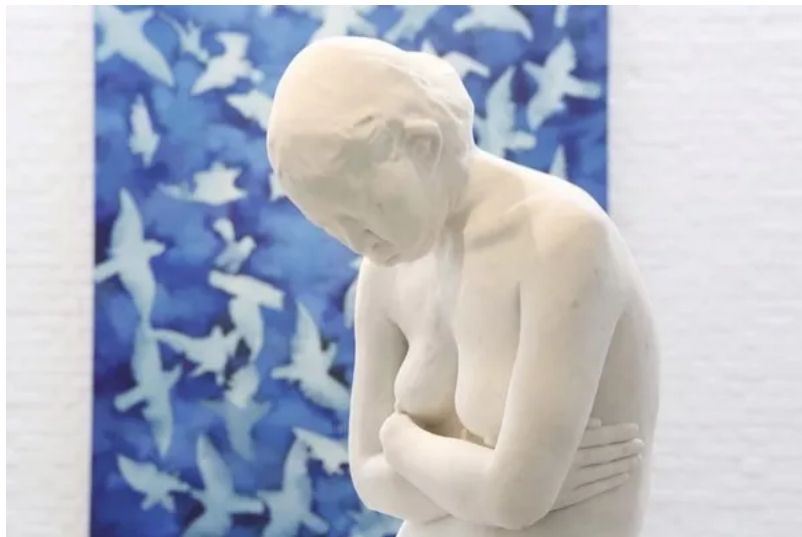
“自然的纪念碑” 展览现场

“蓝晒”系列是张大力“唯心”的开始，他说“从唯物跳到唯心，我看这个世界的时候就站的更高了。”大多数人确信摄影机有写实和记录的功能，所以他们的眼睛与思维很容易被其替代、控制与蒙蔽，而张大力要做的就是去机械化与去数码化，其具体做法是借鉴了约翰·谢赫尔发明的蓝晒法成像技术，这是一种不使用相机，而是将涂有柠檬酸铁铵和铁氰化钾混合溶液的平面材料，直接放置在阳光之下，利用阳光中自然的紫外线成分进行曝光，这样混合液中的二价铁离子被氧化后形成铁盐成分，变成独特奇妙的蓝色铁氰酸盐。它在不同的时间可以记录下实物在光线下形成的影子，也因为物体的透明度和远近，使影子形成深浅不同的色调，接受光线的部位变成深蓝色，而不受光的部位却是白色或浅蓝色如同X光片一般。