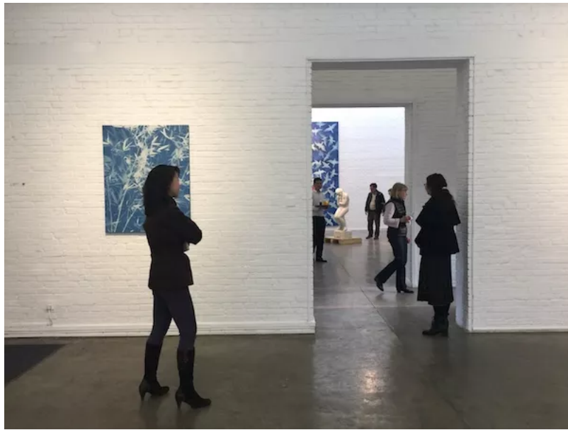
“自然的纪念碑” 展览现场