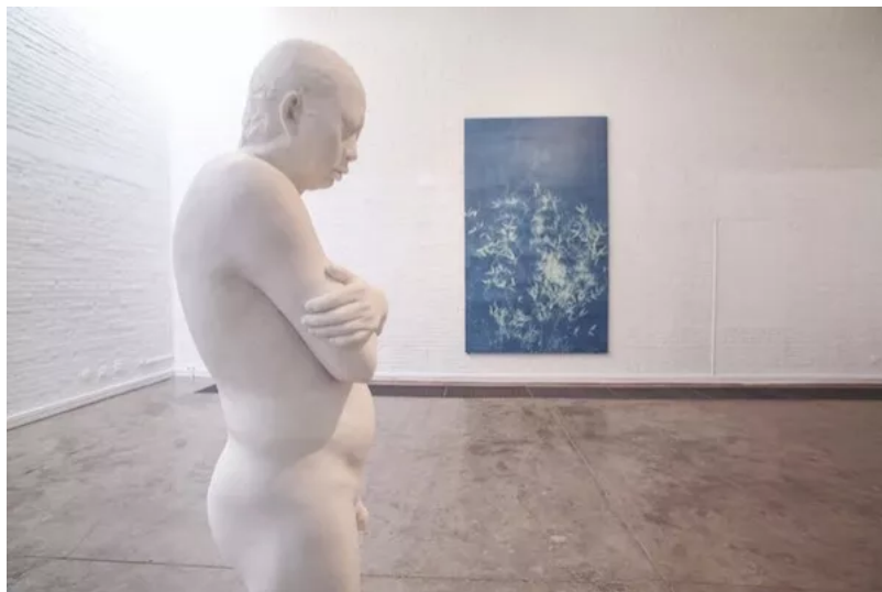
“自然的纪念碑” 展览现场

2018年3月10日北京艺门画廊举办张大力第三次个展“自然的纪念碑”，此次展览呈现了张大力最新的蓝晒系列作品以及人像汉白玉雕塑。张大力1987年毕业于北京中央工艺美术学院，曾经是涂鸦艺术家，2006年之后，尽管他不再进行涂鸦的行为，但是与城市街头生活根深蒂固的联系仍然是他实践的核心。