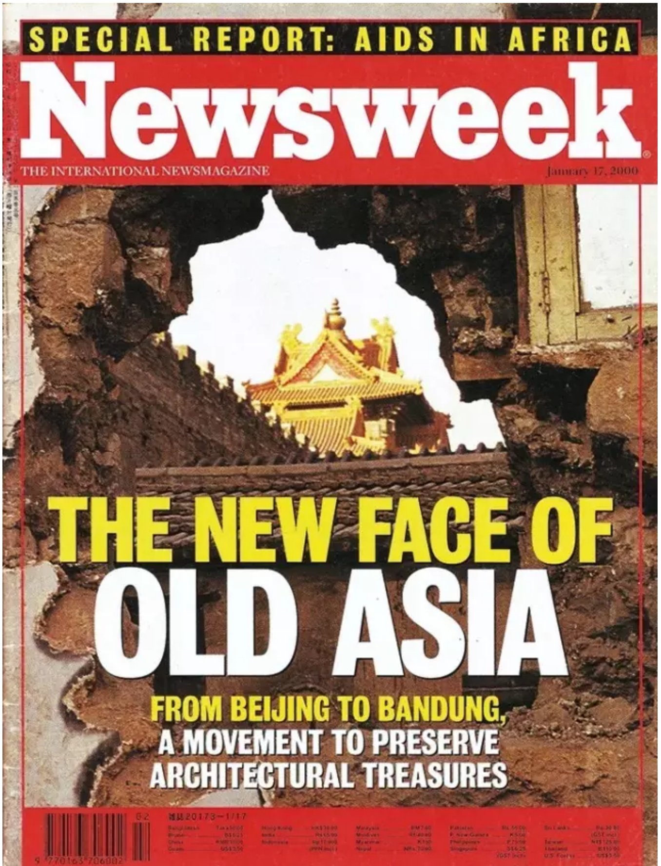
▲ 《新闻周刊》 2000年1月17日