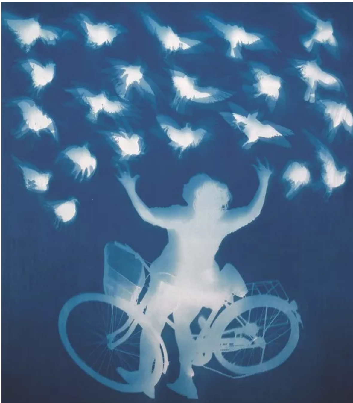
▲ 《飞翔的鸽子》纯棉布蓝晒，258X290cm