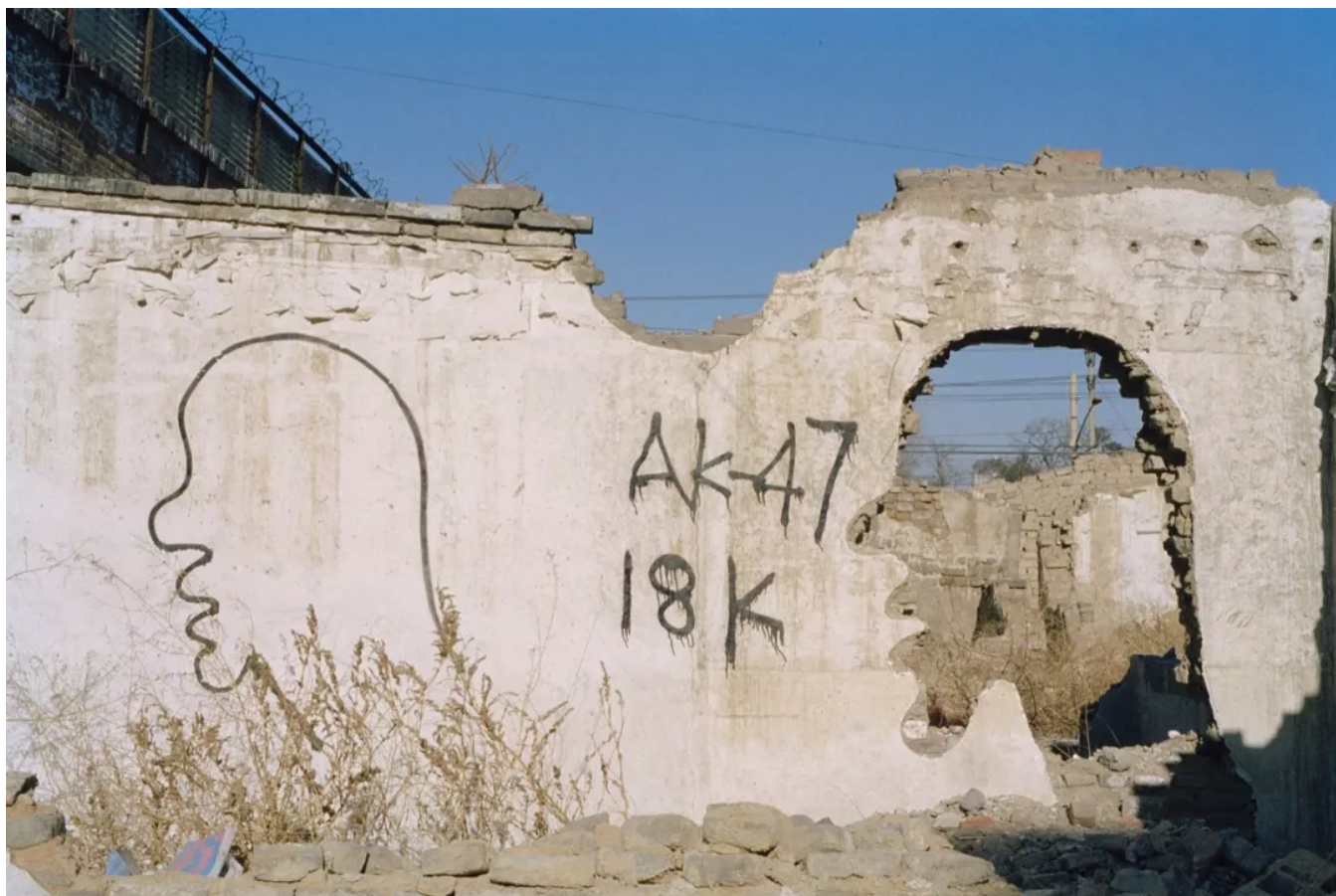
▲ 《对话与拆-朝外大街》，100X150cm，编号1998121

他的作品被全世界最著名的美术馆和基金会所收藏：大英博物馆、伦敦萨奇画廊、纽约现代美术馆、丹佛美术馆、布鲁克林美术馆、纽约国际摄影中心、纽约亚洲协会、路易斯维尔21世纪美术馆、福冈亚洲美术馆、哈弗大学美术馆、武汉合美术馆、广东美术馆、何香凝美术馆、北京民生美术馆。他的作品曾参加2006年第六届韩国光州双年展、2010年第41届阿尔勒摄影节、2011年第54届威尼斯双年展丹麦馆、2011年MoMA新摄影展等大型国际展览。并在中国武汉合美术馆、荷兰海牙雕塑美术馆、北京民生现代美术馆等举办过大型个展。