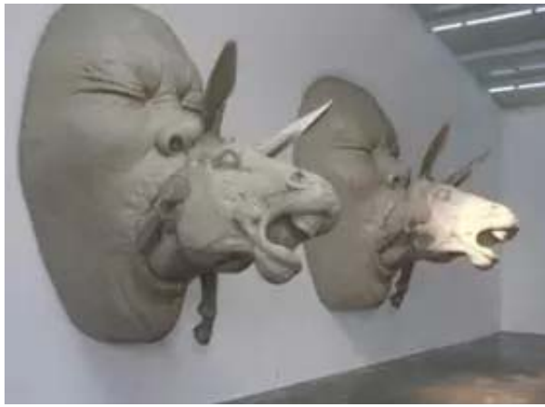
《人与兽》 玻璃钢 350×200×360cm 2008