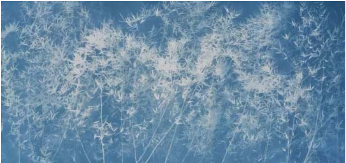
《竹子 No. 10》242 x 512 cm 亚麻布蓝晒 2016