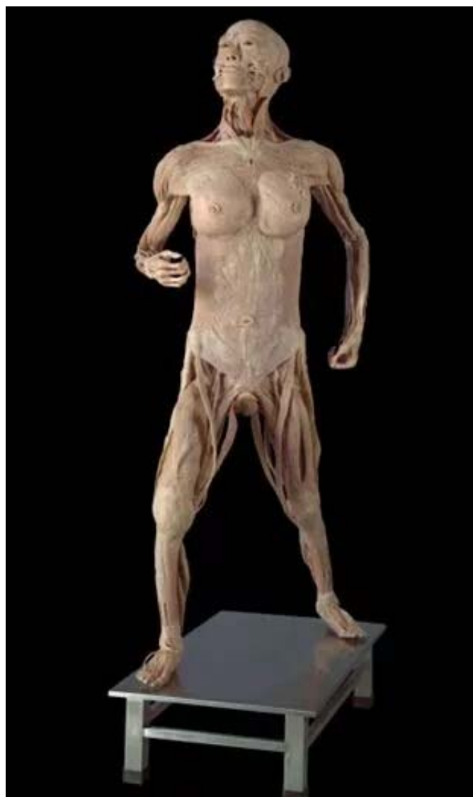
《我们》 人体标本 人体等大 2009