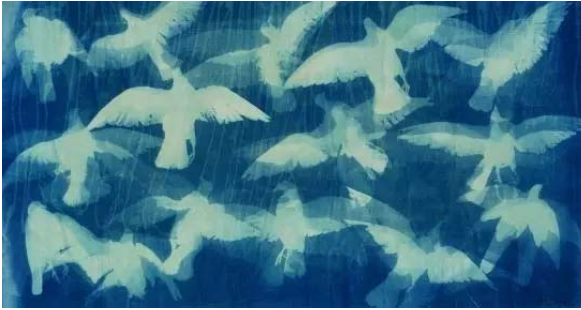
《蓝色天空》220 x 410 cm 蓝晒 2016