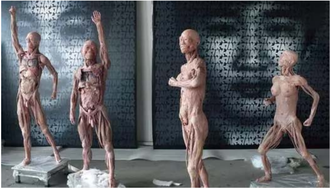
《我们》 人体标本 人体等大 2009