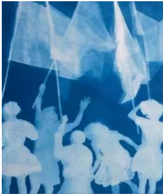
《7月》 纯棉布蓝晒 280×237cm 2011

《我们》之后，张大力开始做《蓝晒》，他说这是唯心的开始，“因为真正的唯物已经到头了”。“蓝晒”系列的创作动机是，大多数人确信摄影机有写实和记录的功能，所以他们的眼睛与思维很容易被其替代、控制与蒙蔽，而张大力要做的就是去机器化与去数码化，其具体做法是借鉴了约翰·谢赫尔发明的蓝晒法成像技术，这是一种不使用相机，而是将涂有柠檬酸铁铵和铁氰化钾混合溶液的平面材料，直接放置在阳光之下，利用阳光中自然的紫外线成分进行曝光，这样混合液中的二价铁离子被氧化后形成铁盐成分，变成独特奇妙的蓝色铁氰酸盐。它在不同的时间可以记录下实物在光线下形成的影子，也因为物体的透明度和远近，使影子形成深浅不同的色调，接受光线的部位变成深蓝色，而不受光的部位却是白色或浅蓝色如同X光片一般。