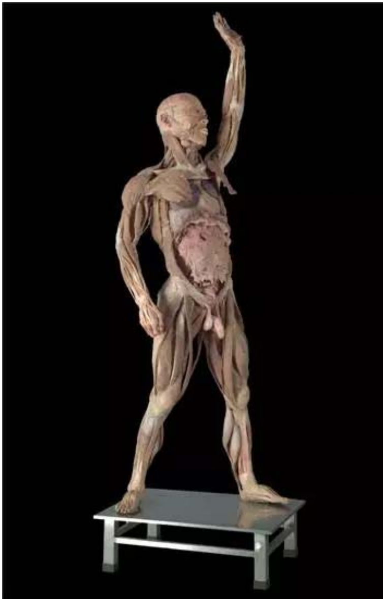
《我们》 人体标本 人体等大 2009

到了2008年的《我们》，张大力对于人体的复制达到了极致，直接使用了尸体。在这组作品中，张大力对人体标本进行了改造，呈现了生活中仪式化、符号化、经典化的动作。《我们》的出现在艺术界与公共舆论领域引发了巨大争议，因这件作品而出现的艺术、伦理、法律乃至信仰的激烈冲突，人们至今对此未能取得共识。这也是唯一一组未能出现在美术馆的作品。