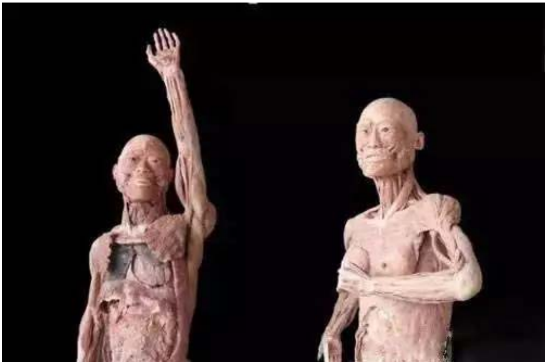
《我们》 人体标本 人体等大 2009