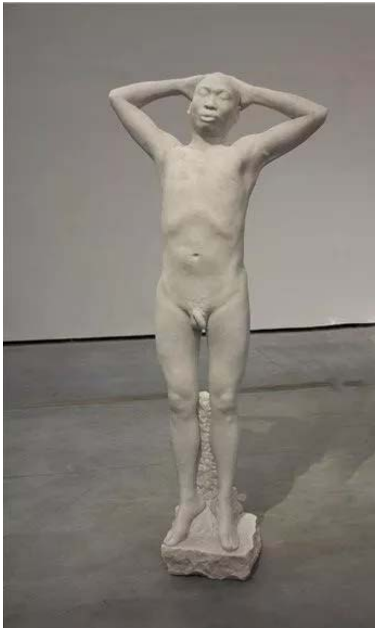
《种族》玻璃钢 人体等大 2005

1990年代，张大力因街头涂鸦《对话与拆》而出名，时至今日，百度百科对其的介绍仍是“涂鸦艺术家”和“中国涂鸦第一人”。