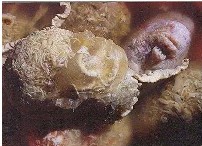
《肉皮冻民工》 肉皮冻 26×20×20cm 2000