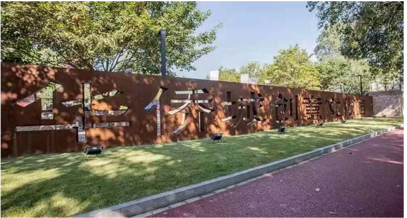
安仁华侨城文化创意园

2019年10月12日，第二届安仁双年展"共同的神话 (A CONFRONTATION OF IDEALS)"即将在成都安仁拉开帷幕，并将持续至2020年2月12日。双年展这种大型的公众展览是时代的产物，在双年展上我们会不可避免的遭遇并碰撞的一切：艺术、艺术家、策展人、艺术机构、参观者、文化政策、市场、公众范围、特殊场合、旅游业和城市标签。