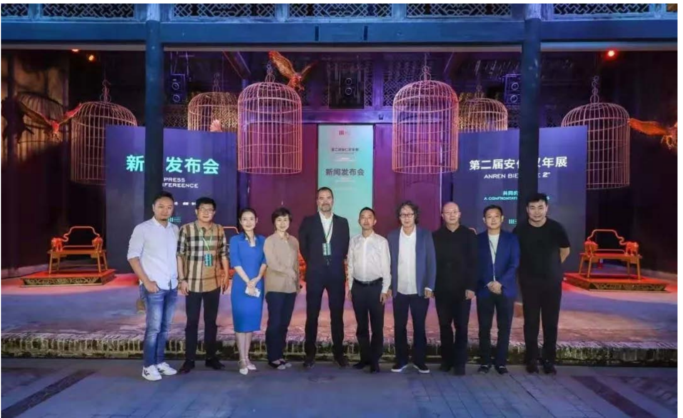
第二届安仁双年展新闻发布会现场

2019年10月12日，第二届安仁双年展"共同的神话 (A CONFRONTATION OF IDEALS)"即将在成都安仁拉开帷幕，并将持续至2020年2月12日。双年展这种大型的公众展览是时代的产物，在双年展上我们会不可避免的遭遇并碰撞的一切：艺术、艺术家、策展人、艺术机构、参观者、文化政策、市场、公众范围、特殊场合、旅游业和城市标签。