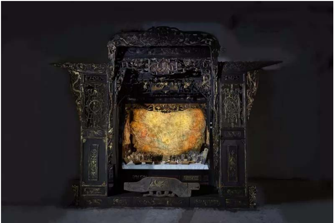
何工 《梦史-误读与塑造》 350x500x320cm装置 2019