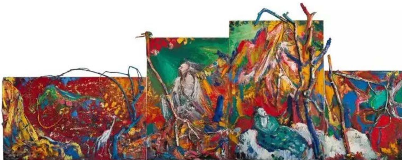
尹朝阳 《松下高士图》927x340x47cm 油彩 布 木头 2019