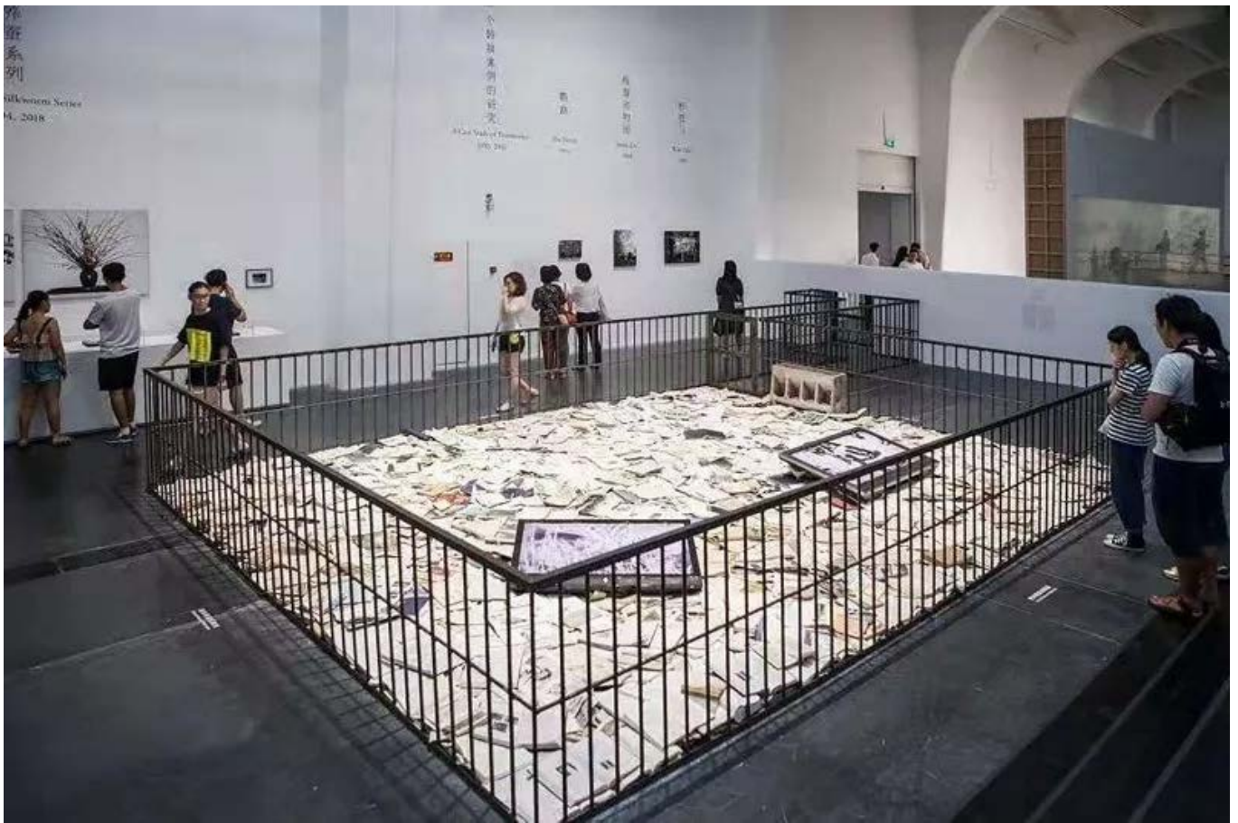
徐冰《一个转换案例的研究》尺寸可变 综合媒材料 2019

对于大型展览的组织者来说，也许最大的挑战就是让流动的观众对精致的作品不是匆匆一瞥，而是对所有作品都有一些见解。99艺术网记者于10月8日在双年展布展现场与策展人吕彭展开对话。