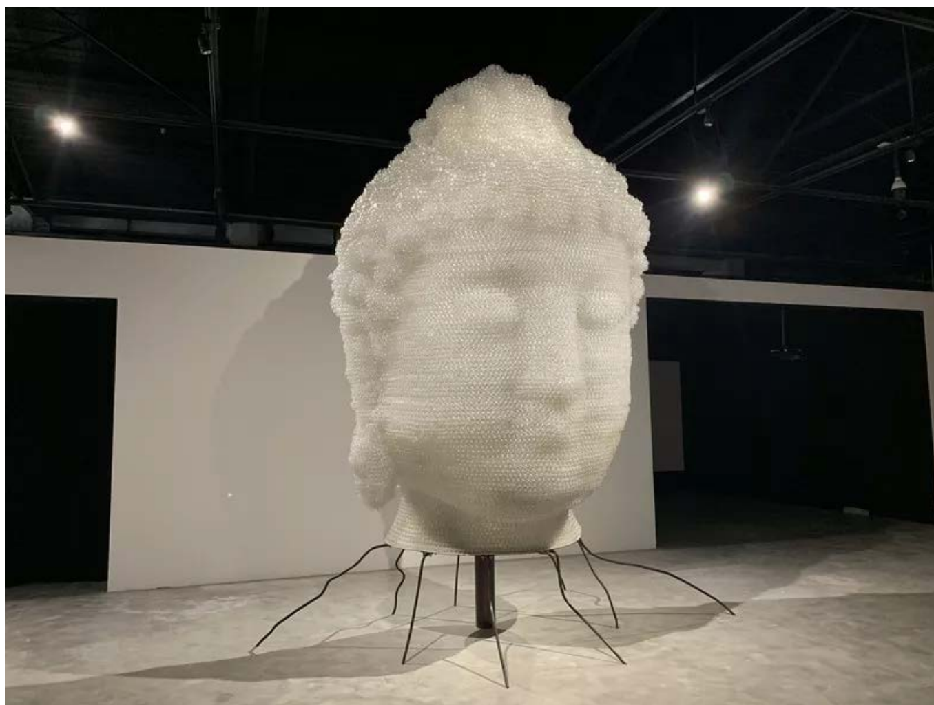
吴达新《药师佛》装置 2019