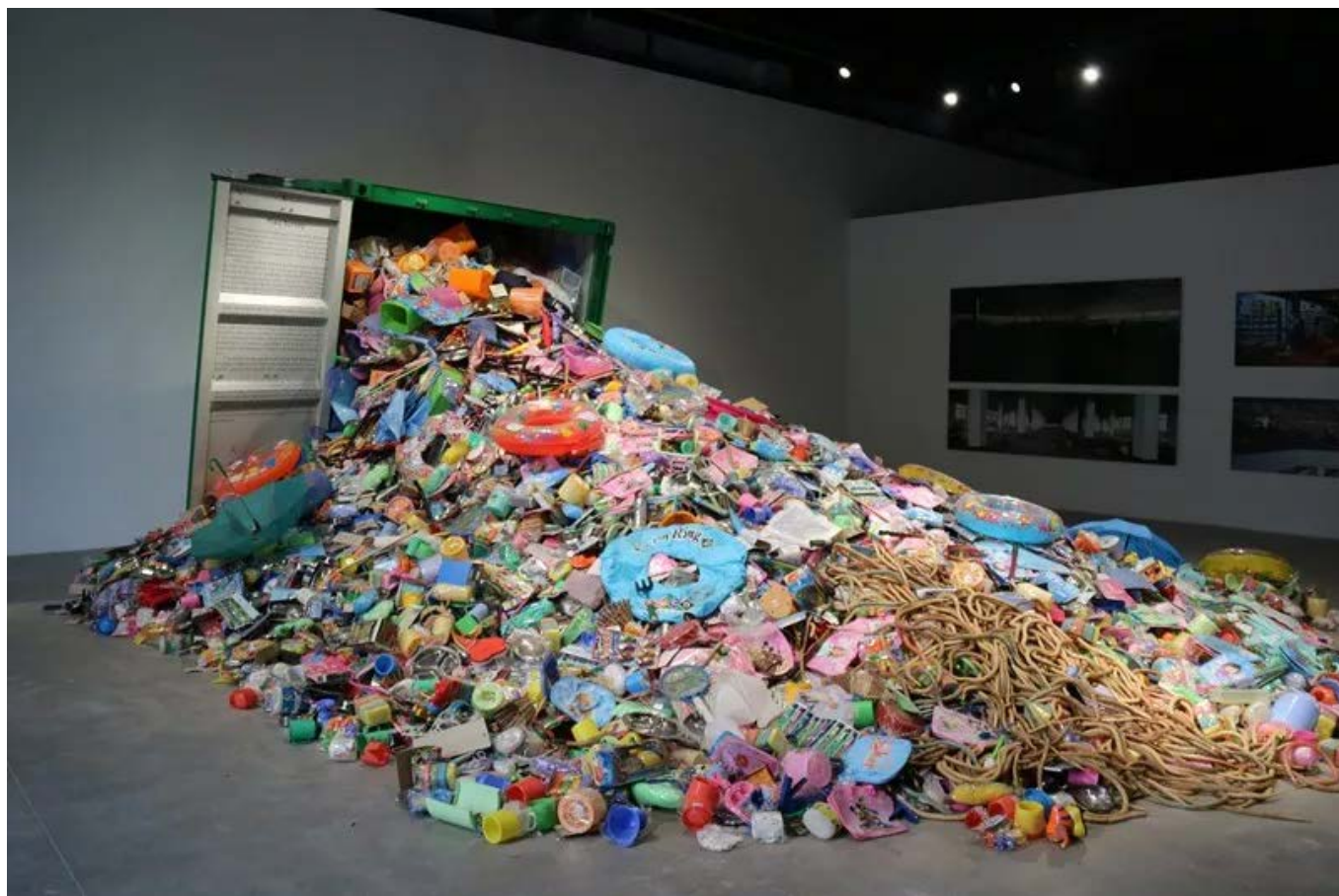
刘建华 义乌调查 尺寸可变 综合材料 2006