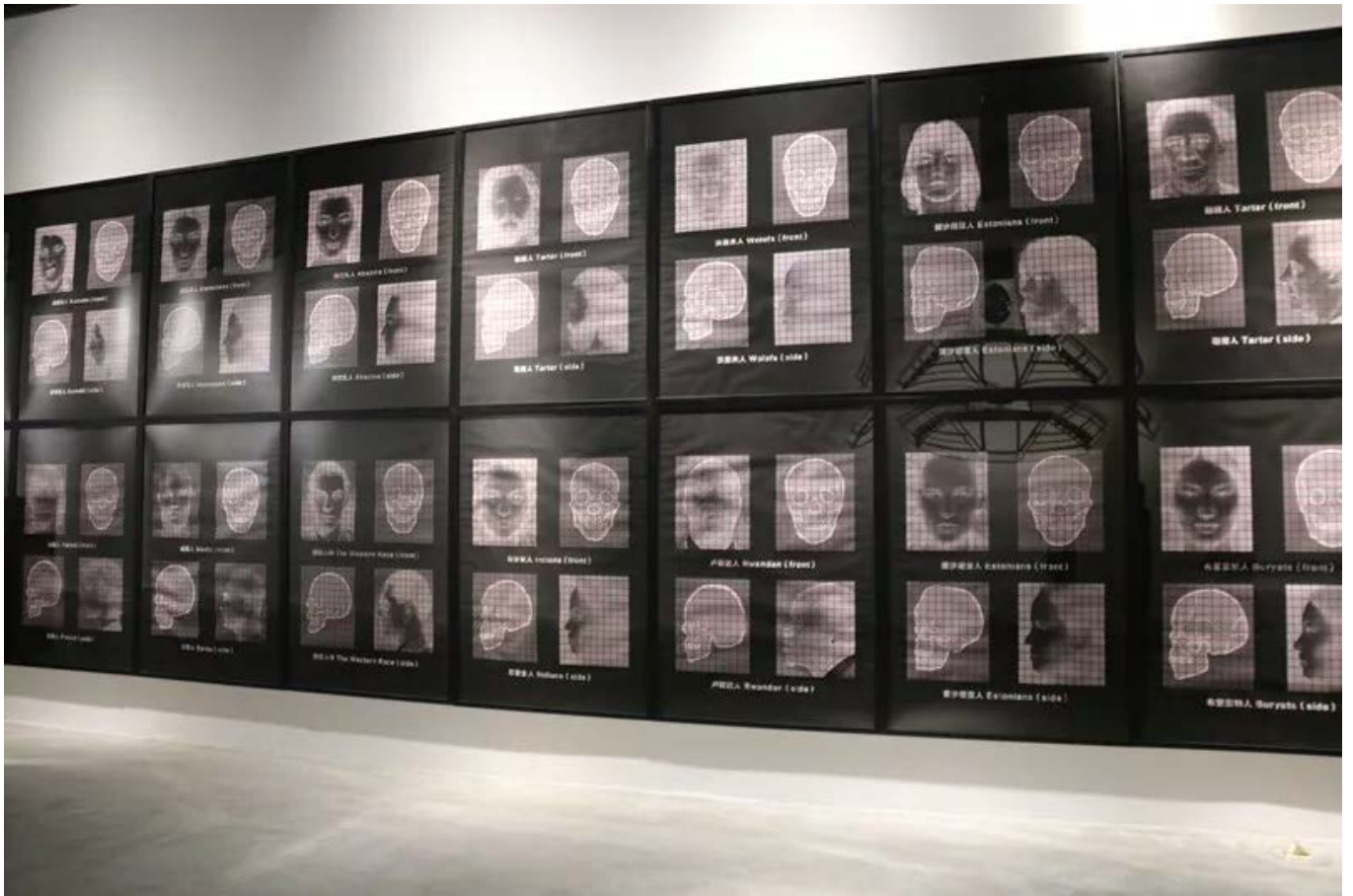
王广义 《通俗人类学研究》种族分析 (160 × 114cm × 44 pieces)