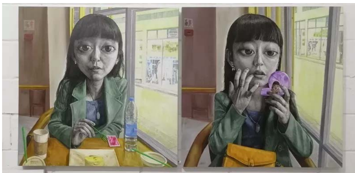
忻海洲 《LiLi的星巴克时间》No.1、No.2 110x110cm×2 布面丙烯油画 2018