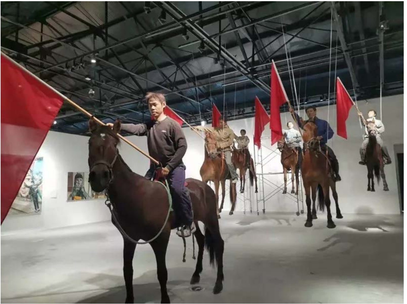
张大力《风马旗》（马标本和蜡像人物）真实尺寸 装置 2008年

双年展主办单位安仁华侨城邀请到了艺术史学家吕澎，四川美术美院教授何桂彦、荷兰著名策展人塞伯·泰德若(Siebe Tettero)作为联合策展人组成策展团队。遵照专业、学术、国际等原则搭建展览结构，制定展览的主题和架构，拟定参展的艺术家名单，选择参展的艺术作品，保证展览的学术性及影响力。届时，将有来自世界各地约60-80位优秀中外艺术家，涵盖了绘画、摄影、雕塑、装置、影像、文献、电影、以及建筑八大类型的作品展示。第二届"安仁双年展"借用东西方两个历史的隐喻，来表达全球化时代当代艺术的主题。在复杂而充满戏剧性冲突的时代，不同文明对世界的观望、相互之间的对话以及交流该如何进行？更多的问题是，什么是全球化时代崭新的宝船，以致将亚洲和其他区域的人们带往地球他乡；而什么样的新的地球仪能够建立人类全新的视角，理解人类文明的昨天、今天和未来？人类如何来建立一个可以共同面对未来挑战的文化共同体？