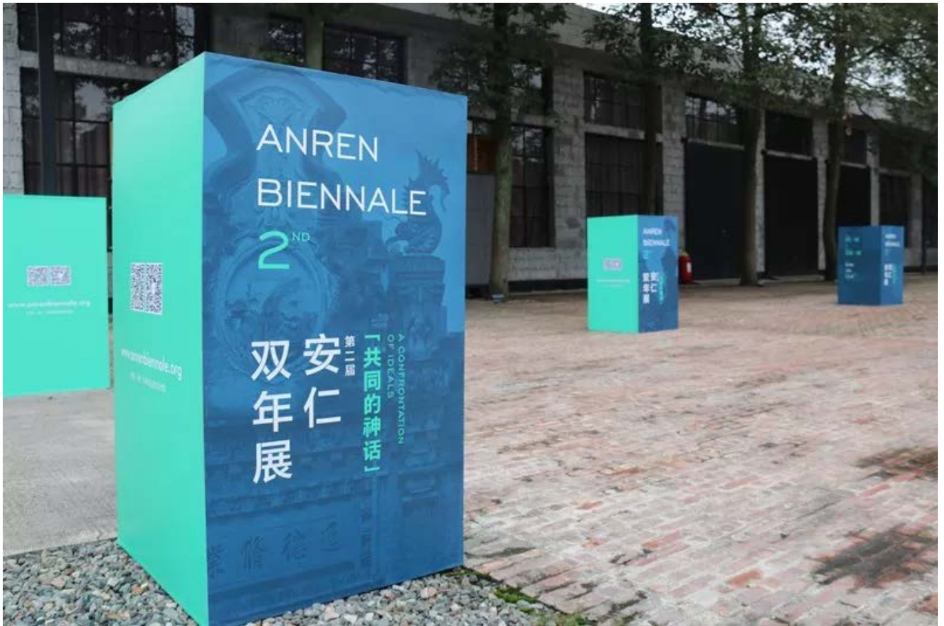
第二届安仁双年展展馆外景

安仁，中国唯一以文博立镇的博物馆小镇。安仁是旧的但又有新的、它传统且当代。"安仁双年展"始创于2017年，是华侨城进入安仁以来在文化艺术领域的第一个国际品牌活动，也是华侨城集团"文化+旅游+城镇化"思路的现实实践。它不仅是一场国际级别的艺术盛宴，也不止是一个多国多样艺术展示与交流的学术平台，它更是安仁华侨城致力发展安仁古镇艺术决心的一个重要开端。相比2017年首届安仁双年展，2019第二届安仁双年展，华侨城集团积累了更为丰富的经验，寄希望于通过当代文化内容与古镇历史环境的结合，以文化促进旅游，以旅游带动区域经济的发展。