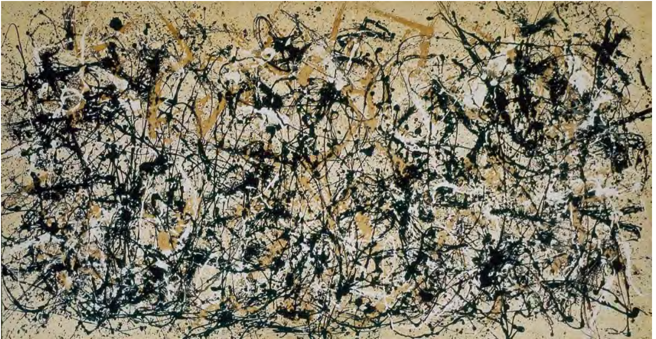
《秋天的节奏——编号30》1950 杰克逊·波洛克，美国大都会艺术博物馆

我认为语言的独创性不是非常重要，用任何语言方式都可以。你画什么、做什么、表现的是 什么，这个最重要。如果语言跟你想表现的东西没有关系，你仅仅是为了语言而语言，艺术 将毫无生气与意义，它不能打动人。我认为抽象表现主义都有它的内容，它并不仅仅是玩语 言，他是有理论基础的。