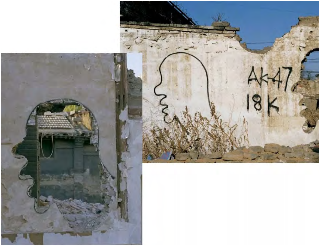
(左) 《拆 2001410D》2012, 图片: 奕来画廊