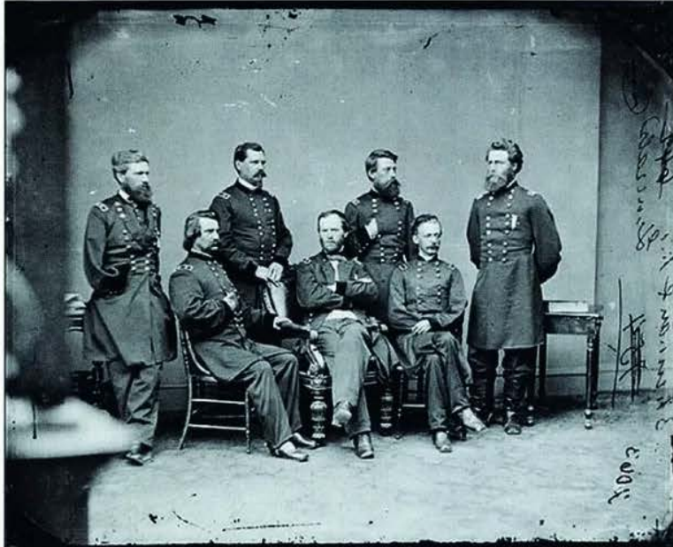
The Original Image

Generally regarded as the world's first commercially successful photojournalist, Matthew Brady was also one of the medium's most accomplished manipulators. In this group portrait of William Tecumseh Sherman and his top officers, he added one figure. For the record, the men are, standing, from left: Oliver Otis Howard, William Babcock Hazen, Jefferson Columbus Davis and Joseph Anthony Mower; seated, from left: John Alexander Logan, Sherman, Henry Warner Slocum and Francis P. Blair.