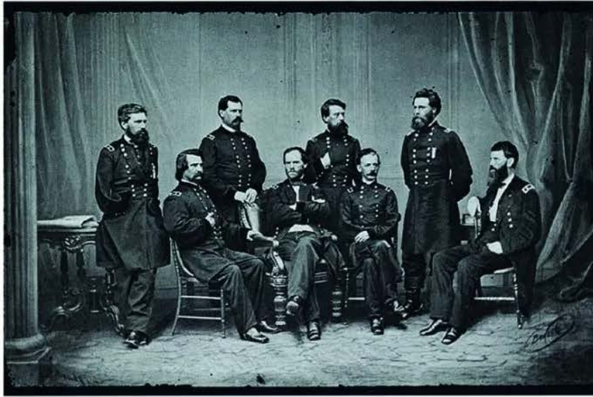
Civil War Generals, c. 1865

Generally regarded as the world's first commercially successful photojournalist, Matthew Brady was also one of the medium's most accomplished manipulators. In this group portrait of William Tecumseh Sherman and his top officers, he added one figure. For the record, the men are, standing, from left: Oliver Otis Howard, William Babcock Hazen, Jefferson Columbus Davis and Joseph Anthony Mower; seated, from left: John Alexander Logan, Sherman, Henry Warner Slocum and Francis P. Blair.