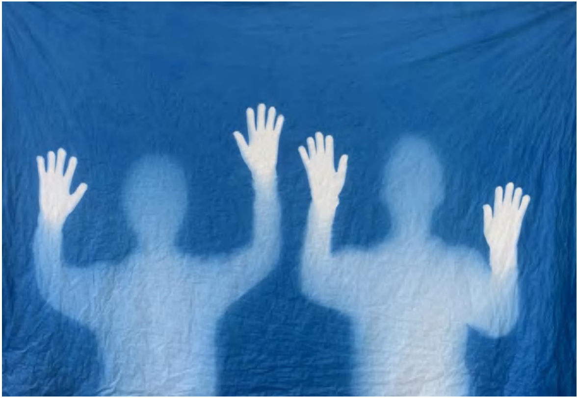
《影子 (54) 》张大力