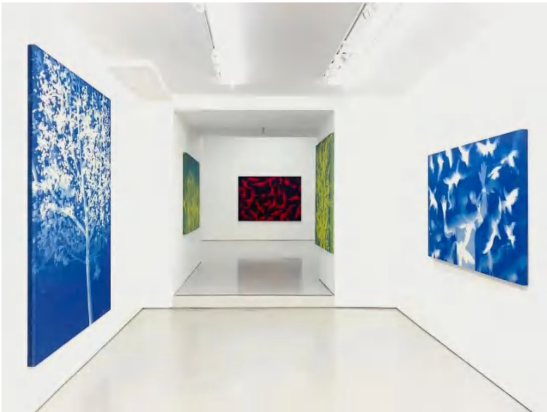
■ 《张大力：Suffocation》，展览现场，奕来画廊，纽约，2023。

作为中国涂鸦艺术家，张大力始终在弄清楚城市和人的复杂状态，以及他们形成的原因和相互构成的关系。在之前的作品里，他依托于城市体系中被拆的建筑物来分析城市的表面变化，之后关注其中生存的人来呈现他们的思想和状态。而展出的蓝晒系列里，他已然将分析对象从前两者延伸至城市内的野生植物。这是一种现实环境的引渡，展现了他对城市边缘区的景观的思考。这种景观不同于其他类型的景观，随处可见的都是一些无价值的野生植物。在植物学家和当地人的眼中，它们或许有着相应的学名和别名，但无论是何种类型的名字都是人类观察后的结果和人自身投射的权利再现，它们反过来也形成了局限性。