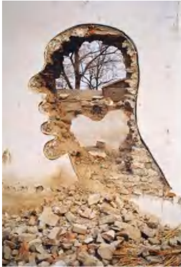
从关注现实到回归内心 ——走进艺术家张大力

张大力是中国第一位涂鸦艺术家，早在上世纪90年代，张大力就以街头涂鸦作品《对话与拆》系列而闻名。在那一时期，由其创作的匿名人头像，不断出现在城市的角落、废墟和隐秘处，进而几乎构成了一种城市文化景观。2006年之后，张大力逐渐转向其他艺术形式与表达媒介，包括绘画、摄影、雕塑等。