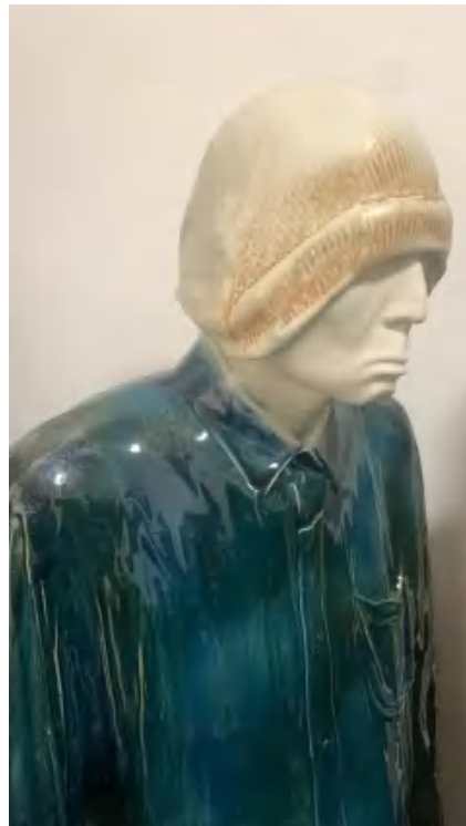
▲ 张大力, 众生 All living creatures, 瓷 Porcelain 91X58X29cm, 2022 ©张大力工作室与K空间