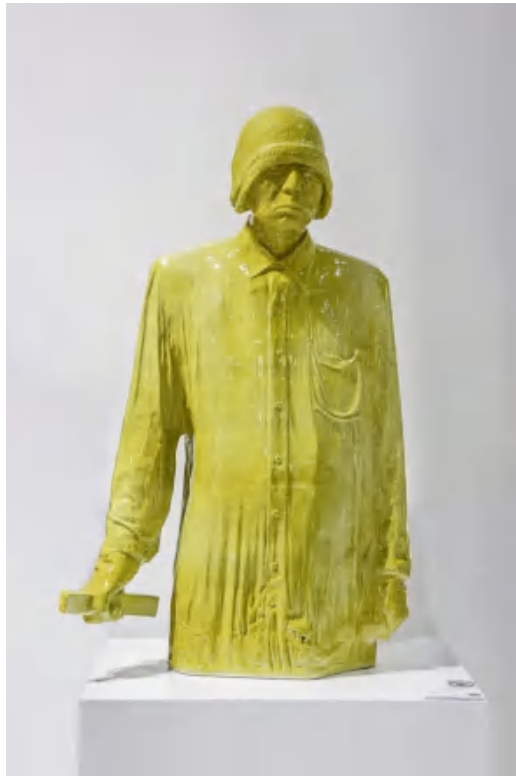
▲ 张大力, 众生 All living creatures, 瓷 Porcelain 91X58X29cm, 2022 ©张大力工作室与K空间