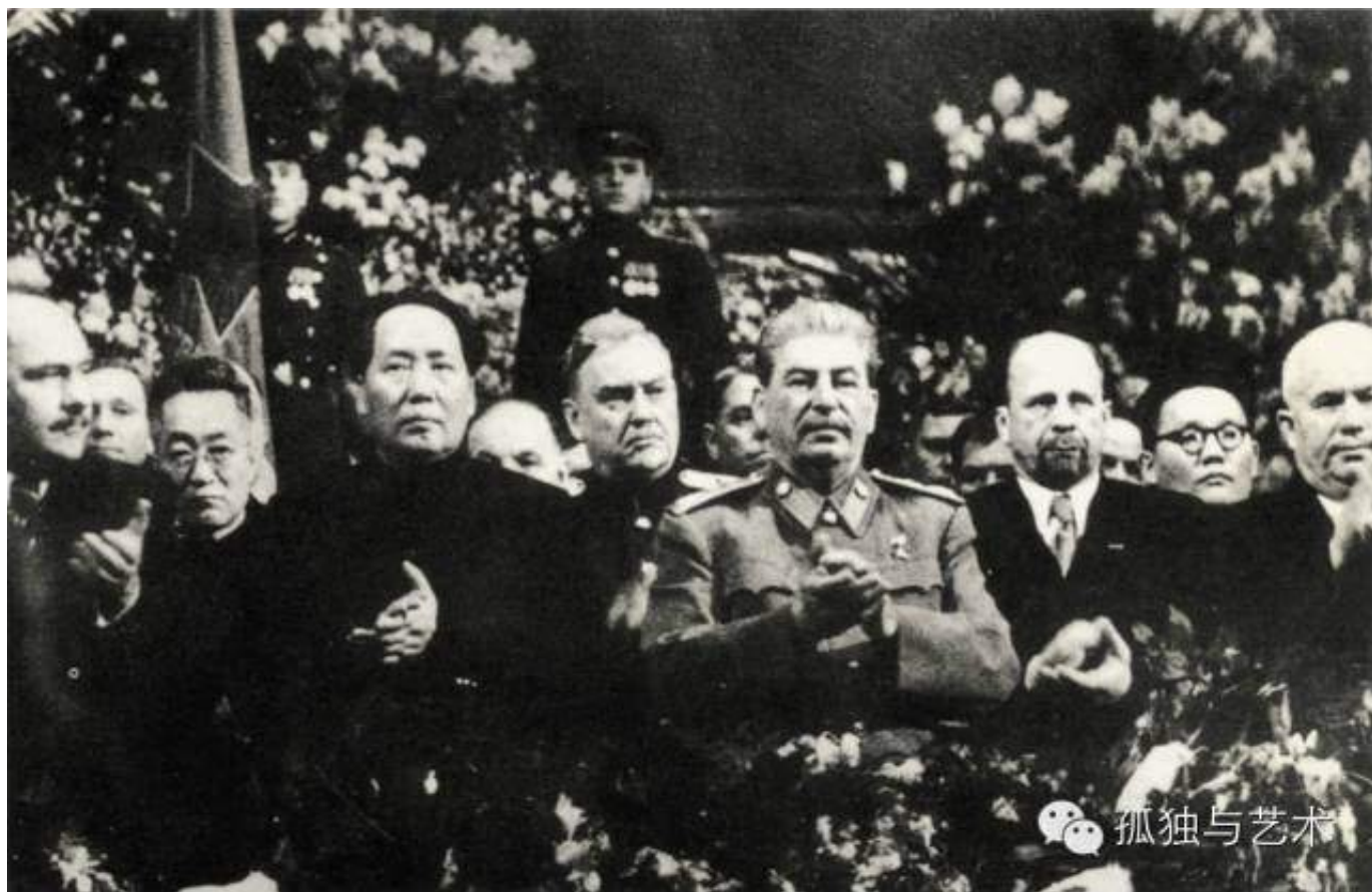
1950年12月，毛泽东同斯大林在一起。