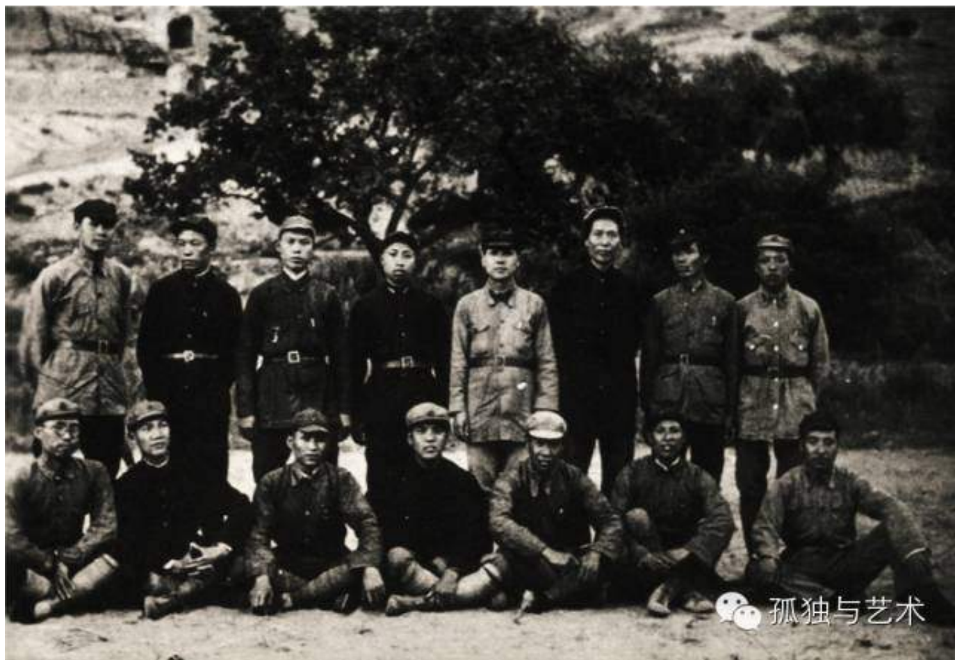
1937年陕北保安合影。（图/由张大力工作室提供）

上图出自：《纪念罗荣桓》，中国人民解放军总政治部《罗荣桓传》编写组编，文物出版社，1990年11月。