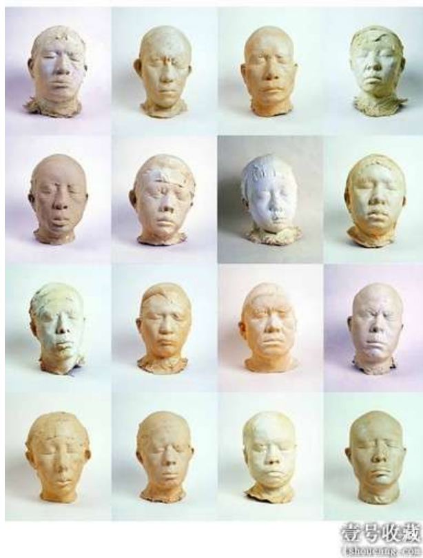
《一百个中国人》拼接图